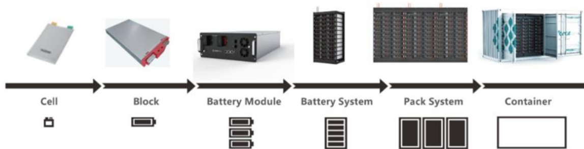
фигура 1 Система за съхранение на енергия ще е разположена в контейнер

Ще се изгради на нова подземна кабелна линия (КЛ) 20 кV тип 3X па2Н5(F)2Y 1x400 m 2 , с дължина L=5 700 m, разположена в сервитута на полски път ПИ 02837.5.1213, второстепенна улица ПИ 02837.501.9540, път от републиканската пътна мрежа ПИ 02837.501.9501 и местен път ПИ 02837.501.9502, ПИ 02837.14.525 до РУ 20 кV на п/ст ВЕЦ „Батак“.